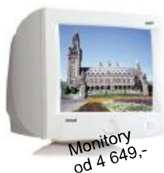
Monitory od 4 649,-

Využijte naší předvánoční nabídky a zajistěte si užitečný dárek včas! Uděláte radost sobě i svým blízkým.