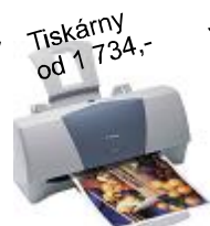
Tiskárny od 1 734,-