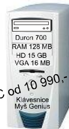
PC od 10 990,- Duron 700 RAM 128 MB HD 15 GB VGA 16 MB Klávesnice Myš Genius